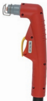
TBi TTC 81

120 A / 60% Luft oder N 2 / Air or N 2 , 4.6-5.0 bar 200 l/min luftgekühlt / air cooled Hypertherm Powermax 1000, 1250, 1650