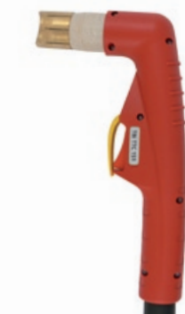
TBi TTC 151

150 A / 60% Luft / Air, 4.5-5.0 bar 220 l/min luftgekühlt / air cooled TRAFIMET A140, Ergocut A141