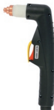
TBi RPT 100HY

80 A / 60% Luft oder N 2 / Air or N 2 , 4.4-5.0 bar 110 l/min luftgekühlt / air cooled Hypertherm Powermax 600, 800, 900