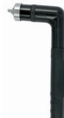
TBi PLC 250W

150 A / 60% Luft / Air, 4.5-5.0 bar 220 l/min luftgekühlt / air cooled CEBORA P150, CB160