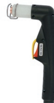
TBi PLC 150

100 A / 60% Luft / Air, 4.5-5.0 bar 180 l/min luftgekühlt / air cooled LINCOLN T 100