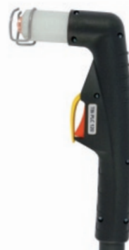
TBi PLC 120

90 A / 60% Luft / Air, 4.5-5.0 bar 160 l/min luftgekühlt / air cooled CEBORA P90