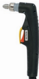
TBi PLC 90

70 A / 60% Luft / Air, 4.5-5.0 bar 130 l/min luftgekühlt / air cooled CEBORA P70