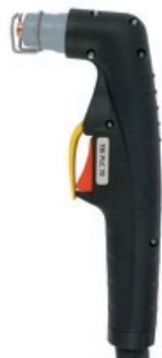
TBi PLC 70

50 A / 60% Luft / Air, 4.5-5.0 bar 120 l/min luftgekühlt / air cooled CEBORA P50