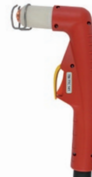
TBi TTC 141

100 A / 60% Luft / Air, 4.5-5.0 bar 180 l/min luftgekühlt / air cooled Hypertherm A90, Ergocut A101