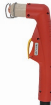
TBi TTC 101

80 A / 60% Luft / Air, 4.5-5.0 bar 160 l/min luftgekühlt / air cooled TRAFIMET A80, Ergocut A81